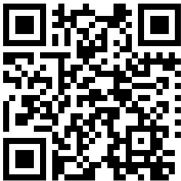
说明书 Word 版下载二维码

本产品可用于车队的管理，在车辆数量多于一台时，可以组建一个车队，使用车队管理员登陆服务平台（请提供需要规划车队的设备 ID 号及要使用的用户名，由公司或代理商账号操作），可看到整个车队车辆的信息并可以对整个车队车辆进行监控和操作管理。